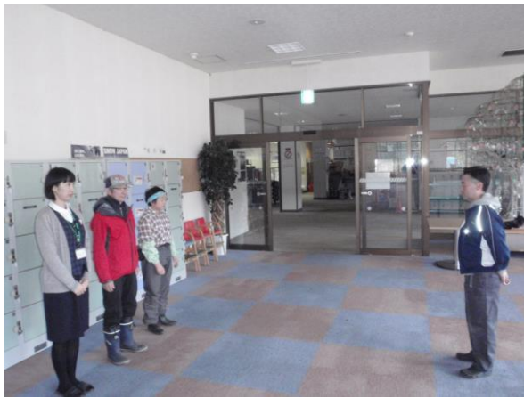
H29/11/8 総合防災訓練状況