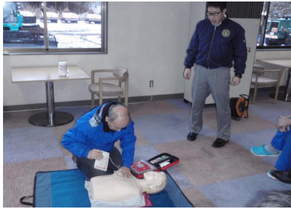
H29/12/8 AED（自動体外式助細動器）講習状況