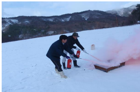
H29/12/9 オーパスプラザ火災発生を想定しての消火訓練実施状況