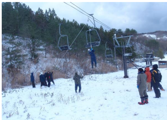
H29/12/9 第三ペアリフトにて従業員教育での救助訓練状況